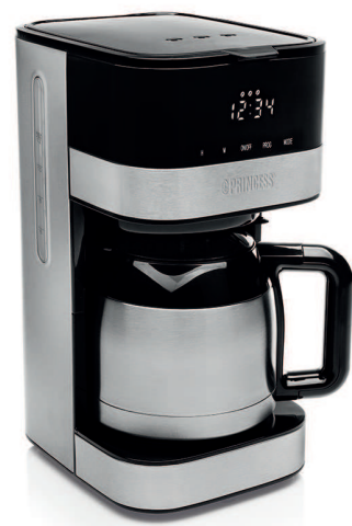
Coffee Maker Lucca Iso 01.246012.01.001

PARTS DESCRIPTION / ONDERDELENBESCHRIJVING / DESCRIPTION DES PIÈCES / TEILEBESCHREIBUNG / DESCRIPCIÓN DE LAS PIEZAS / DESCRIÇÃO DOS COMPONENTES / DESCRIZIONE DELLE PARTI / BESKRIVNING AV DELAR / OPIS CZĘŚCI / POPIS SOUČÁSTÍ / POPIS SUČASTI / ОПИСАНИЕ ЗАПЧАСТИ