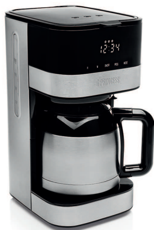
Coffee Maker Lucca Iso 01.246012.01.001

PARTS DESCRIPTION / ONDERDELENBESCHRIJVING / DESCRIPTION DES PIÈCES / TELEBESCHREIBUNG / DESCRIPCIÓN DE LAS PIEZAS / DESCRIÇÃO DOS COMPONENTES / DESCRIZIONE DELLE PARTI / BESKRIVNING AV DELAR / OPIS CZĘŚCI / POPIS SOUČÁSTÍ / POPIS SOUČASTÍ / ОПИСАНИЕ ЗАПЧАСТІ